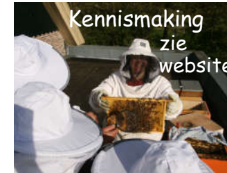
Kennismaking zie website