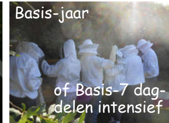
Basis-jaar of Basis-7 dag- delen intensief