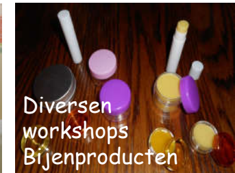
Diversen workshops Bijenproducten